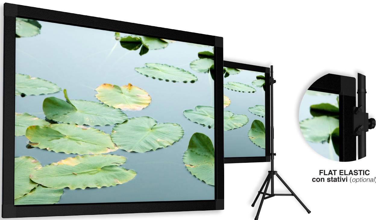
FLAT ELASTIC con stativi (optional)

Gli schermi FLAT ELASTIC e FLAT PRESS presentano tutte le qualità di uno schermo a cornice, unite ad una incredibile semplicità di montaggio. Risultano essere schermi adatti al professionista che necessita sia di una installazione rapida e precisa che di una ottima riuscita della proiezione.