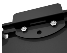
Staffa fissaggio a parete

* Angoli in alluminio con taglio a 45° su schermi superiori a 300 cm di base.