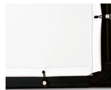
Flat Elastic: sistema di ancoraggio posteriore ad aste ed elastici