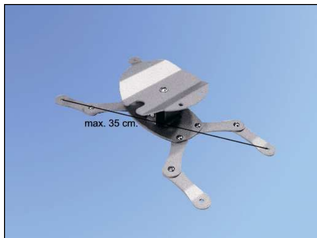
PROJECTOR ARM B-7 - vista laterale